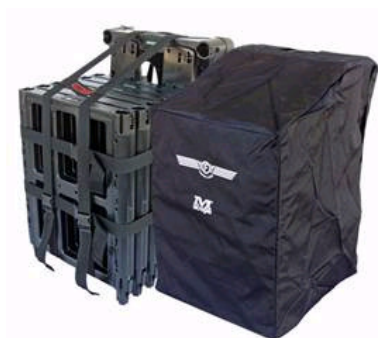
M-scope med transportväska