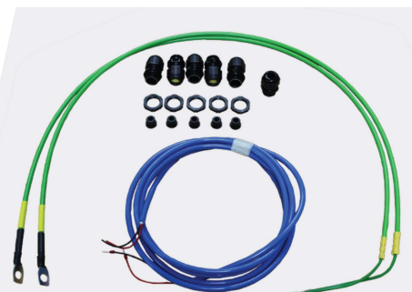
Sats C - med Ex (e) kabeltätningar för icke-förstärkta kablar